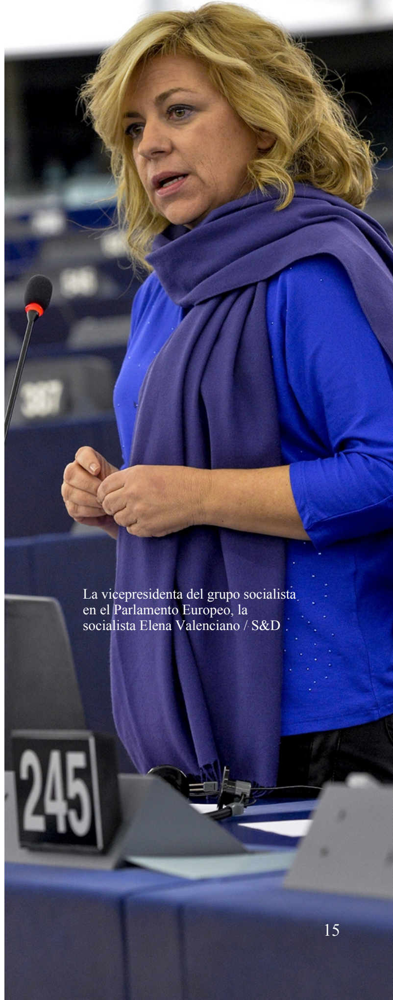
La vicepresidenta del grupo socialista en el Parlamento Europeo, la socialista Elena Valenciano

En el día Internacional contra la Homofobia y la Transfobia, la portavoz socialista ha recordado que, formalmente, Chechenia es parte de la Federación Rusa, "pero el Kremlin mira para otro lado y deja hacer, a pesar de que "formalmente también, Rusia es parte de la Convención Europea de Derechos Humanos, que prohíbe la tortura y la discriminación por cualquier motivo". "La Unión Europea debería... LEER MÁS ►