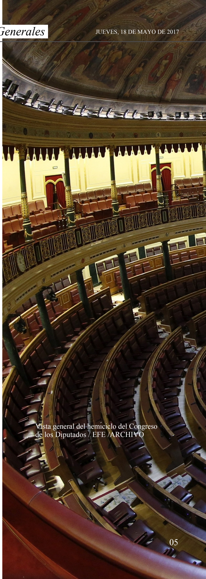
Vista general del hemiciclo del Congreso de los Diputados