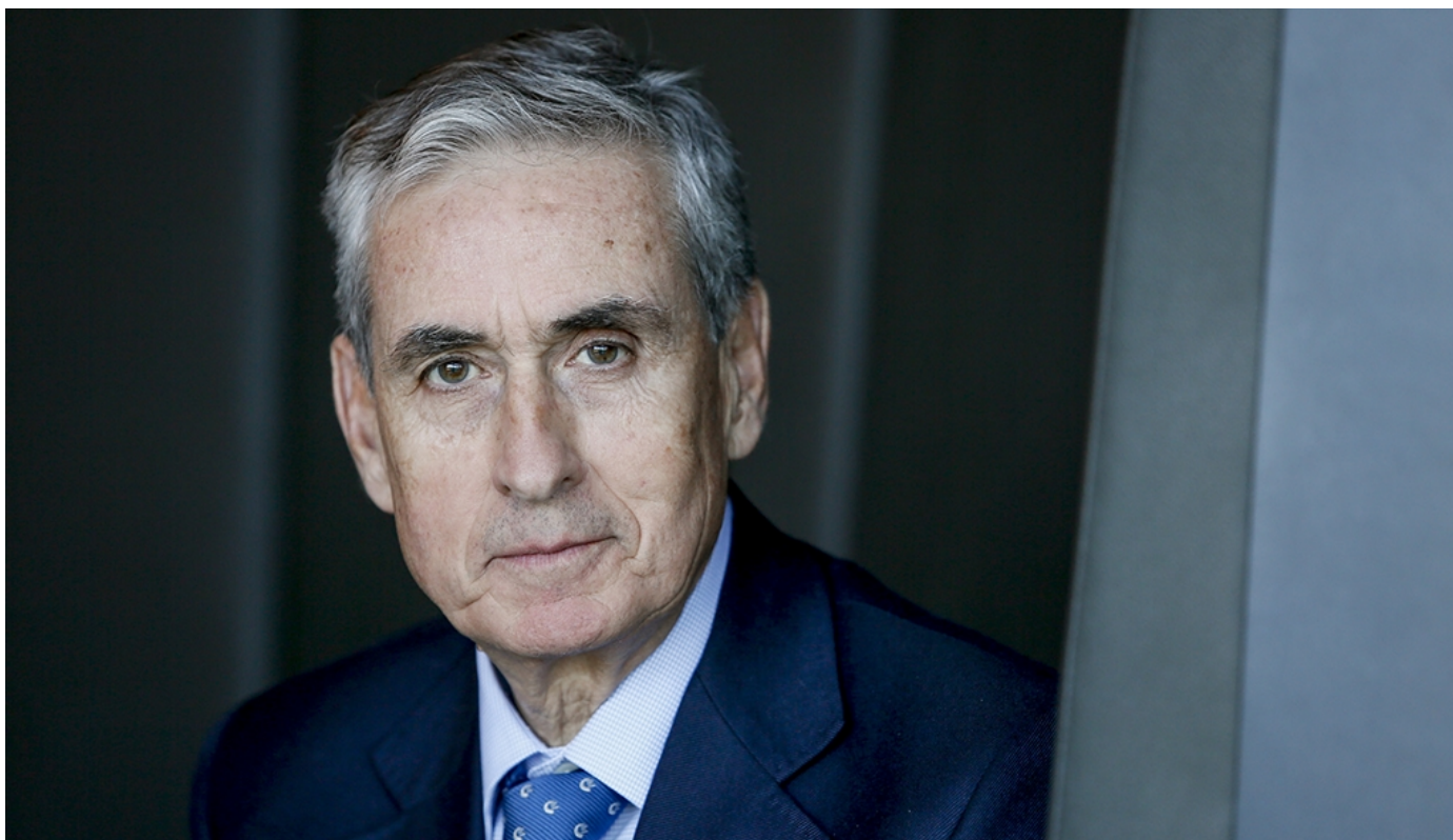
El presidente de los socialistas españoles, Ramón Jáuregui

BRUSELAS / El grupo socialista en el Parlamento Europeo promoverá una resolución de urgencia en la sesión plenaria del mes de junio sobre los crímenes contra periodistas, defensores de derechos humanos y líderes comunitarios en México.