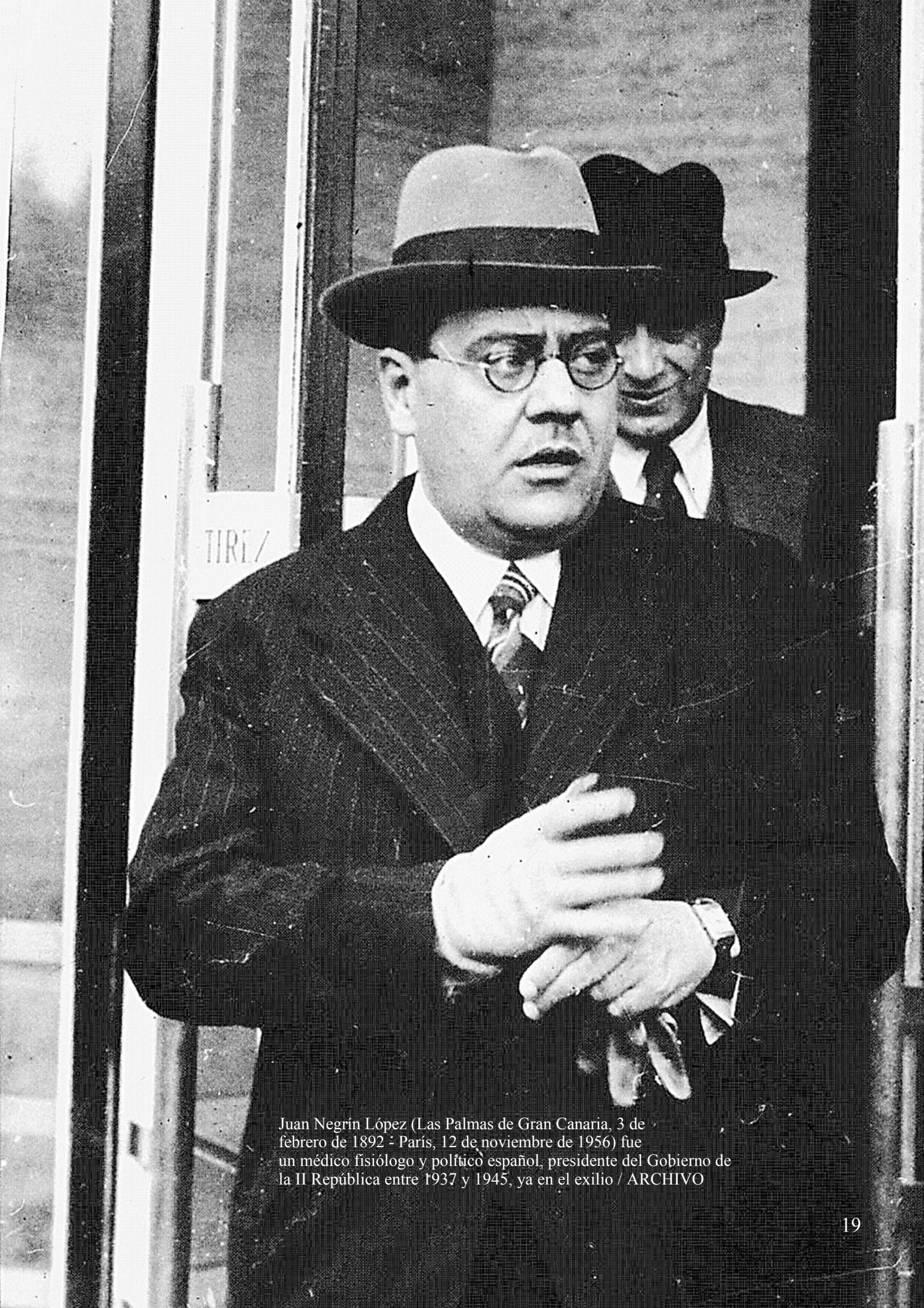
Juan Negrín López (Las Palmas de Gran Canaria, 3 de febrero de 1892 - París, 12 de noviembre de 1956) fue un médico fisiólogo y político español, presidente del Gobierno de la II República entre 1937 y 1945, ya en el exilio